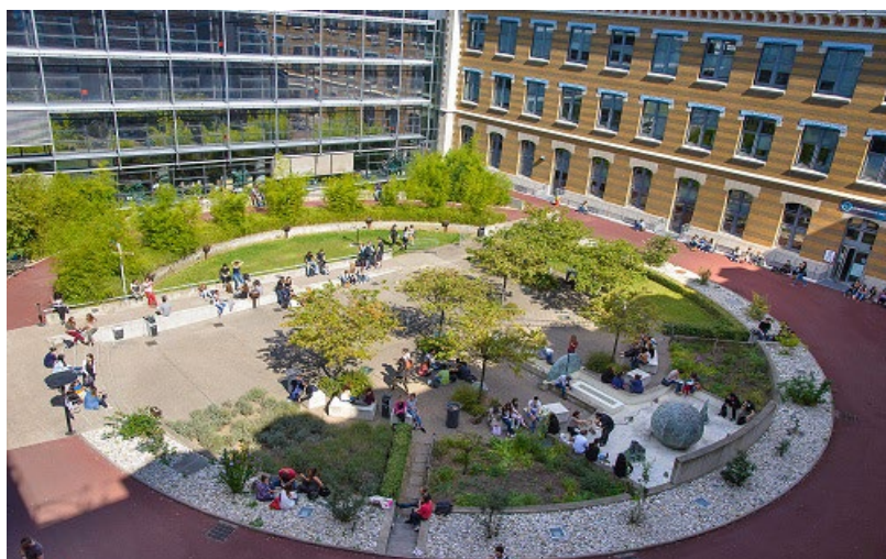
Université Lyon 3

Les étudiants.es passent la deuxième année en France, à l'Université Jean Moulin Lyon 3 en suivant les enseignements du Master « Traduction et Interprétation », parcours « Traduction Commerciale et Juridique » (semestre 3) et en effectuant un stage (semestre 4).